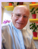
Por: Padre Olmes Milani, c.s.

El evangelista Juan nos recuerda que el amor de Dios no escatima nada, ni siquiera a su único y amado Hijo Jesús, a quien envía para abrir a todos las puertas de la felicidad eterna. Al mismo tiempo que Cristo nos salva, nos da la lección de cómo recorrer el camino de dar el don de la vida. Es el camino de la salvación, de la vida plena y definitiva.