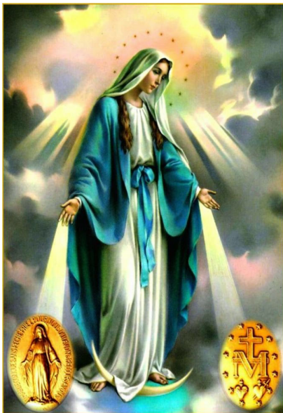
NUESTRA SEÑORA DE LA MEDALLA MILAGROSA 27 de noviembre

En 1830 la Santísima Virgen María se le apareció a Catalina Labouré, joven de 24 años, en París, Francia. Ella comisionó a Catalina que hiciera copias de lo que llegó a conocerse como la "Medalla Milagrosa", producida y distribuida para beneficio de los fieles. La medalla incluye la plegaria: "María, sin pecado concebida, ruega por nosotros, que recurrimos a ti".