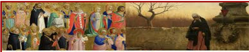
ALL SAINTS & ALL SOULS DAY SCHEDULE

World Mission Sunday is a day set aside for the Catholic Church throughout the world to publicly renew its commitment to the missionary movement, coordinated by the Pontifical Mission Societies, who are a/k/a 'Missio.' It is celebrated on the penultimate Sunday of October every year.