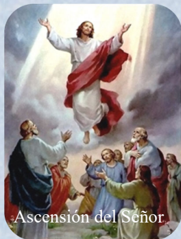
Ascensión del Señor