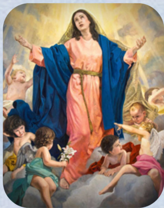
15 de Agosto