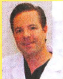
Your Catholic Dermatologist